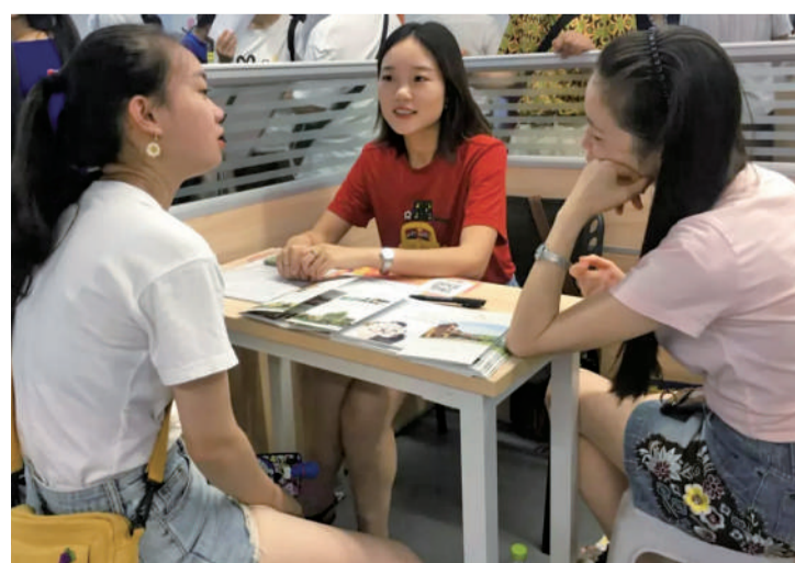
求职者正在与招聘人员进行交流

接下来,各就业见习基地还将走进高校开展宣讲,为即将毕业的高校生提供进入基地上岗锻炼的机会。