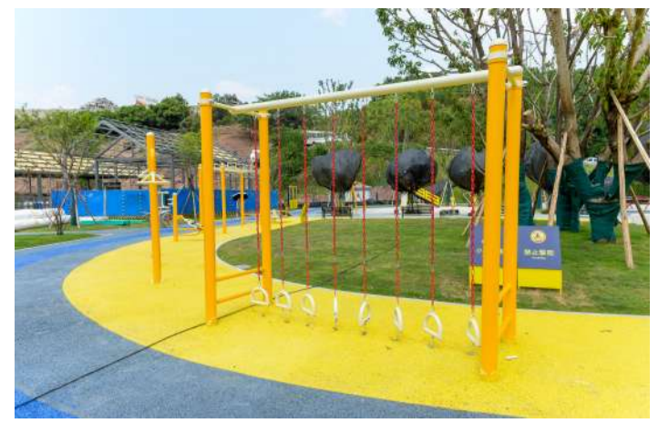
华岩体育文化公园建成开放 03版